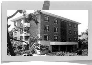
< 평등생활관 (70명) >