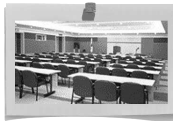
< 국제회의장 >

1층 홀과 2층 객석의 형태로 구성되어 대규모행사 집회 가능 최대 1,300명까지 이용가능