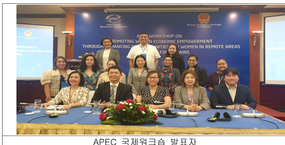
APEC 국제워크숍 발표자